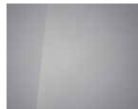
Cyber Grey (Metallic) 1