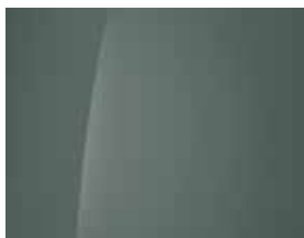
Mirage Green (Uni)