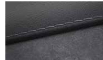
Velour-Leder Fossilgrau 1