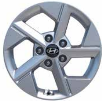
6,5 J x 16-Zoll-Leichtmetallfelgen mit 205/65 R 16 Bereifung 1,3