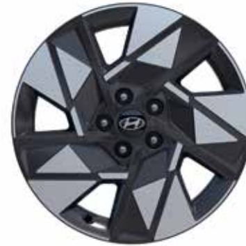
7,0 J x 18-Zoll-Leichtmetallfelgen mit 215/55 R 18 Bereifung