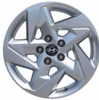
7,0 J x 17-Zoll-Leichtmetallfelgen mit 215/60 R 17 Bereifung 2