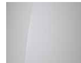
Serenity White (Mineraleffekt) 1,2