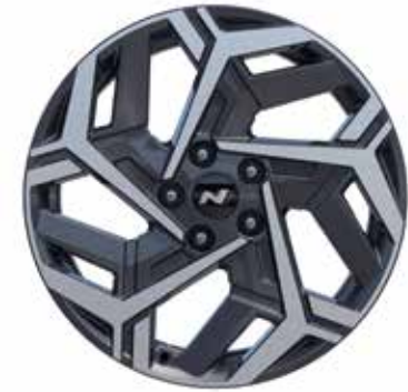
7,0 J x 18-Zoll-Leichtmetallfelgen mit 215/55 R 18 Bereifung