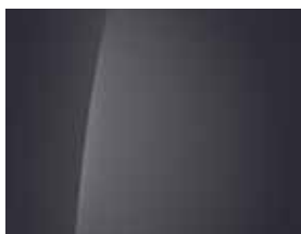
Ecotronic Grey (Mineraleffekt) 1