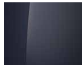
Denim Blue (Mineraleffekt) 1