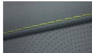
Leder Salbeigrün 1