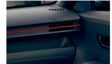
Innenraum in Schwarz mit roter Applikation