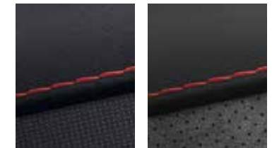
Stoff Schwarz mit roten Akzenten Leder-Eco-Alcantara-Kombination 1