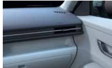
Innenraum Grau 2-Tone