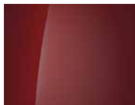
Ultimate Red (Metallic) 1